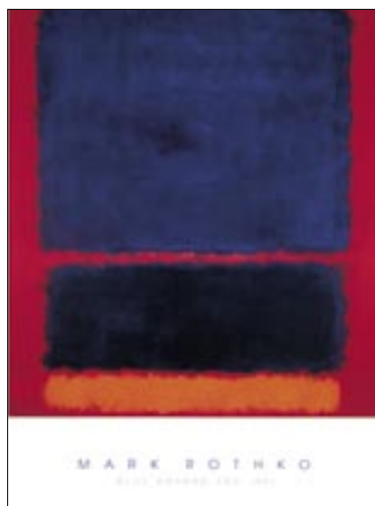
Auch Kunstdrucke in angenehmen, warmen Farben verändern die Praxisatmosphäre bereits erheblich.