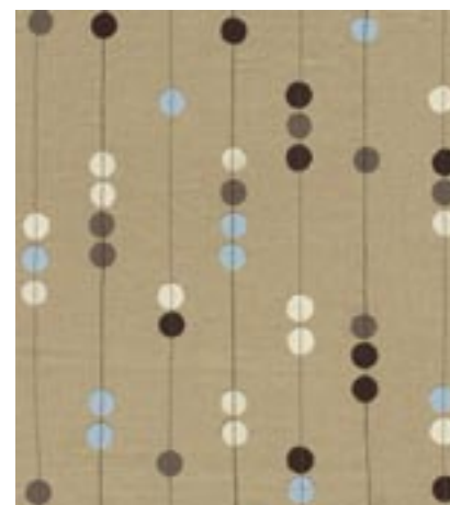
Augenschmaus für Patienten: Auf Keilrahmen gespannte Motive ohne Rahmung wirken wie eigens für die Praxis gemalte Bilder und sorgen für Stimmung.

Bei der Bildersuche muss nicht unbedingt nach Künstlern gesucht werden. Alle Bilder sind mehrfach verschlagwortet, so dass bereits mit einfachen Worten oder Farben wie z.B. „orange“ eine Auswahl mehrerer Motive angezeigt wird. In der Profisuche kann sogar nach Bildgröße und maximalem Preis gesucht werden.